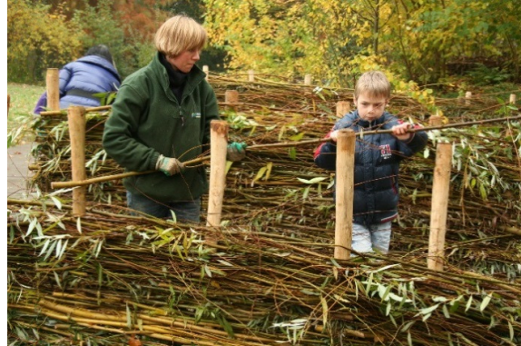
Les op het terrein. 'Afval bestaat niet'. Hergebruik van materialen. Leerlingen maken een hek van wilgentenen.

Uit de respons blijkt dat leerkrachten verwachten minder aandacht te zullen geven aan natuur en milieu. Sommige leerkrachten zullen zelf een les samenstellen met behulp van School-TV of met de leerlingen bijvoorbeeld een aflevering van het Klokhuis bekijken. Het is een mogelijkheid, het zelf invullen van dit thema, maar het geniet niet de voorkeur van de leerkracht. De inhoud van de lessen zullen dan meer van de kinderen vragen op cognitief gebied. De levendige, praktische manier om de leerstof op de kinderen over te brengen, wordt dan gemist. Leerkrachten zijn van mening dat kinderen hierdoor minder leren en het onderwerp minder interessant wordt. Het wegvallen van het NME-aanbod sluit ook niet aan bij de manier waarop het onderwijs zich op dit moment ontwikkelt. De scholen laten kinderen tegenwoordig namelijk steeds meer leren door te doen en te ervaren in plaats van door enkel stof vanuit een boek of scherm te doceren.