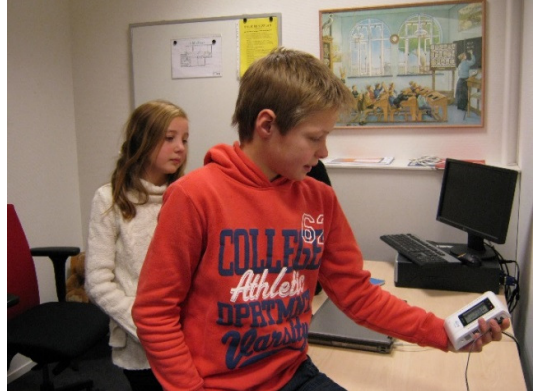
Leerling meet de Co2 in de klas tijdens de les Energieke Scholen.

In dit hoofdstuk komt de bekendheid met en de tevredenheid over de lessen bij Weizigt aan bod. Kennen de leerkrachten het gehele lesaanbod en hoe beoordelen zij de les die zij op dat moment volgden? De leerkrachten die op dat moment een 'doe-het-zelf les' gaven, konden niet aangeven hoe zij de begeleiding door vrijwilligers dan wel medewerkers waardeerden. Bij deze les begeleidt de leerkracht namelijk zelf de les. De vraag 'wat vindt u van de begeleiding van deze les?' is daarom hen niet beantwoord.