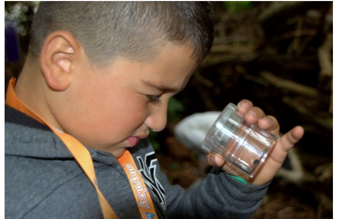
Jonge onderzoeker. Welk waterbeestje zie ik?

Ondanks deze positieve score blijft het belangrijk dat Weizigt scherp is op wat zij doet. Het volgen van ontwikkelingen in het onderwijs en het actualiseren van de lessen blijft noodzakelijk. Hiervoor zal het educatieteam van Weizigt de komende tijd de contacten met de pabo weer versterken. Daarnaast zal Weizigt investeren in het relatiebestand en de contacten met het primair onderwijs via projecten zoals 'Energieke Scholen' en door actieve communicatie het belang van NME breder uitdragen.