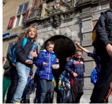
Wandelen voor Water 2014 Leerlingen ervaren hoe het is om 6 km te lopen met 6 liter water op je rug, de normaalste zaak ter wereld voor leeftijdsgenootjes in ontwikkelingslanden. De opbrengst van de sponsorloop gaat naar een sanitatieproject in een ontwikkelingsland.